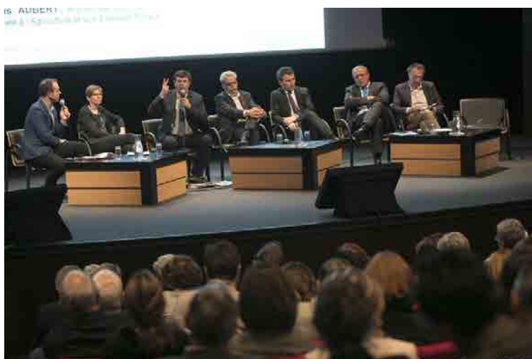
Assises de lancement, 12/04/2017, Beaune